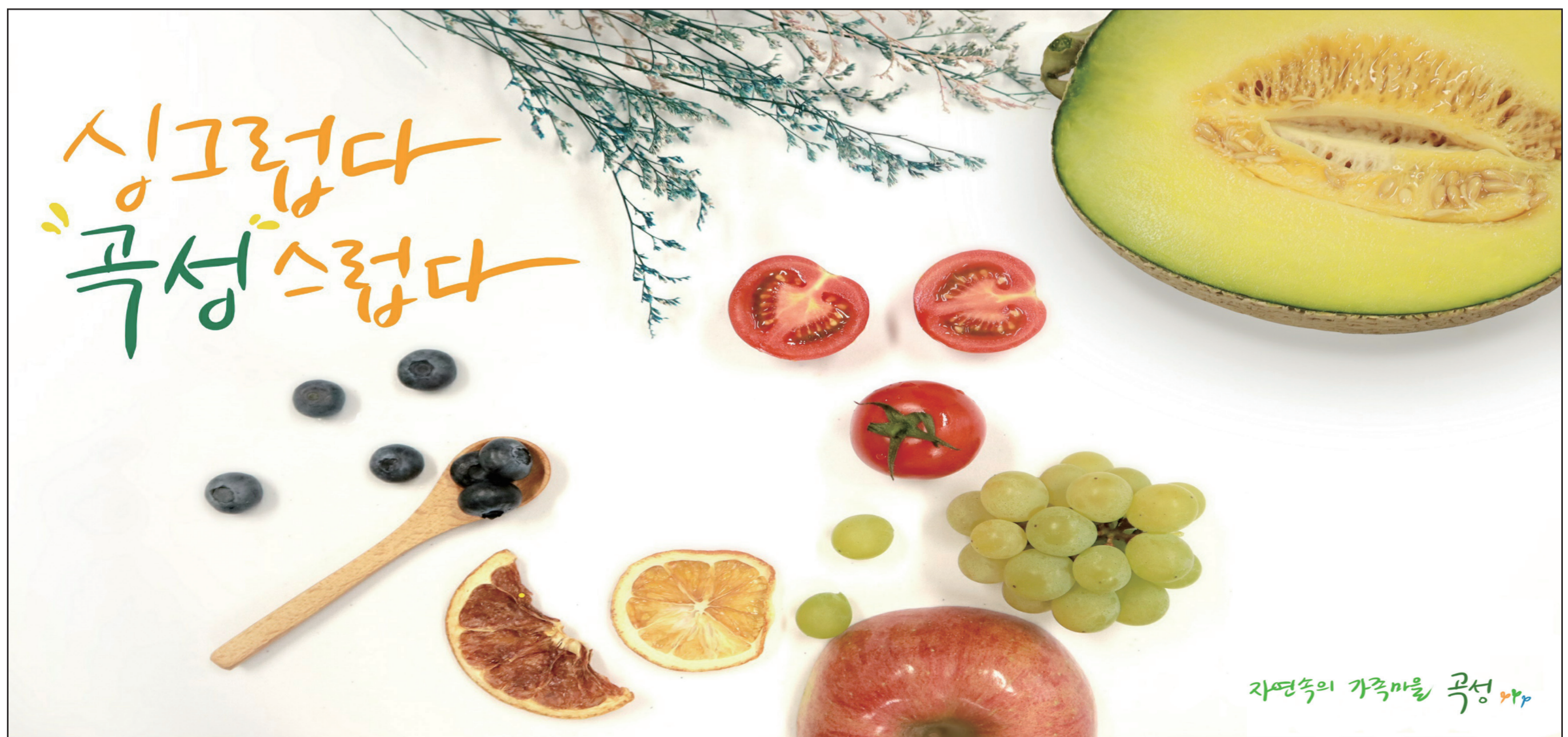
자연속의 가족미를 곡성에서