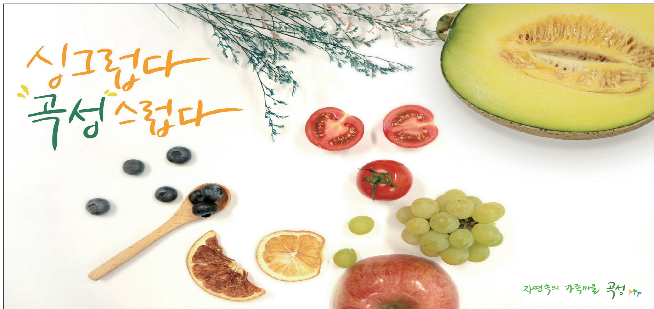
자연속의 가족미를 곡성 사과

광전매일신문 기사제보 TEL. (062) 525-9775 FAX. (062) 528-4566