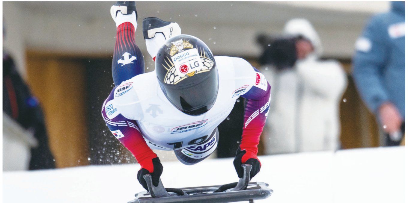
정승기가 스위스 생모리츠에서 열린 2025-26 국제봅슬레이스켈레톤연맹(IBSF) 월드컵 6차 남자 스킨레톤 경기를 펼치고 있다. 정승기는 1,2차 시기 합계 2분 17초81로 5위를 기록했다. /뉴시스

2023년 세계선수권대회 동메달리스트인 정승기는 한동안 허리 부상으로 고생하다가 이번 올림픽 시즌을 앞두고 트랙으로 복귀했다. 올 시즌 3차 월드컵에선 동메달을 따는 등 페이스가 좋다. /뉴시스