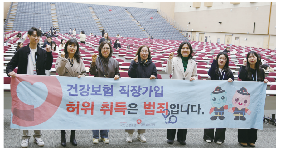
건보공단 광주전라제주본부, 광주지방세무사회 소속 직원