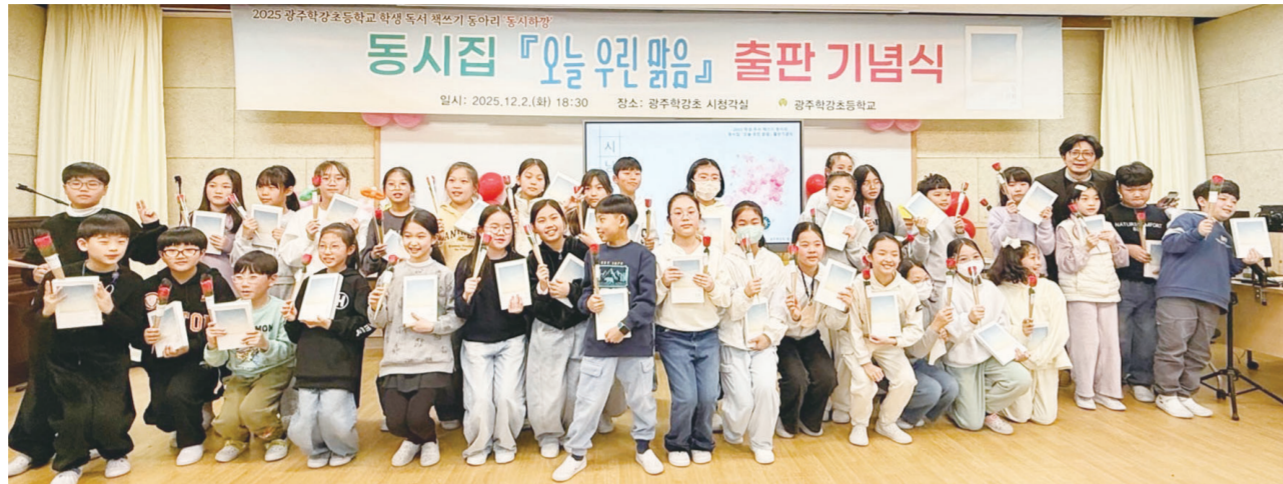
광주학강초등학교(이하 광주학강초)는 지난 2일 본교 시청각실에서 교내 독서 책쓰기 동아리 ‘동시하강’ 4학년 학생 34명 학생의 동시집 발간과 작가에 뷔 축하 기념으로 하고자 ‘출간 기념식’을 개최하고 사냥송회를 진행했다.

뷔한 11살 어린이가 작가들이 문학적 성과를 나누며 가족, 친구, 독자와 소통하는 시간을 가졌다.