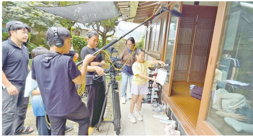
화순 청동초등학교 학생들이 '할머니와 나와 민들레'라는 정편영화를 촬영하고 있다.