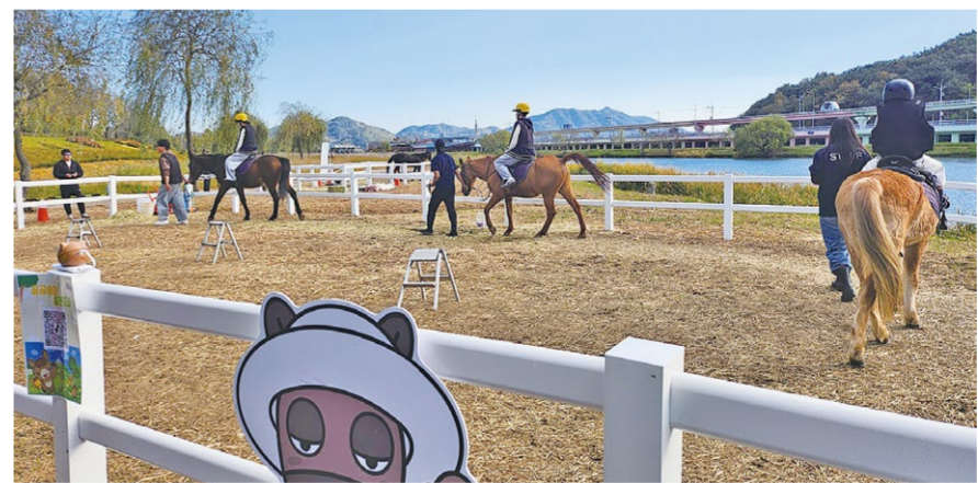
지난 11월 국가정원스페이스브릿지하부 동천변에서 진행된 승마체험.

순천시가 오는 6일부터 7일까지 이틀간 풍덕수변공원 특설 경기장에서 '제1회 순천시장배 팔마 유소년 승마대회'를 개최한다고 밝혔다.