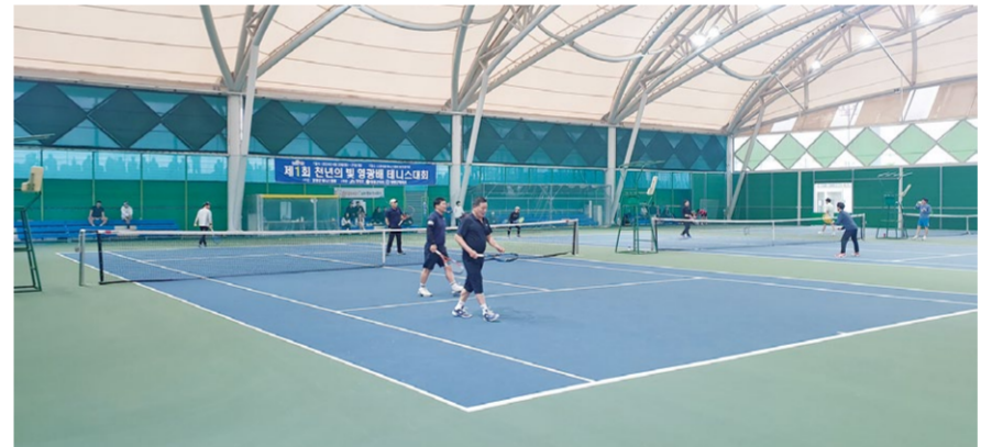
오는 6일 영광스포티움 테니스장을 포함한 영광내 9개 구장에서 '제2회 천년의 빛 영광 동호인 테니스대회'가 열린다. 사진은 지난해 대회 모습.

영광군(군수 장세일)이 오는 6일(토) 영광스포티움 테니스장을 포함한 9개 구장에서 "제2회 천년의 빛 영광 동호인 테니스대회"를 개최한다고 밝혔다.