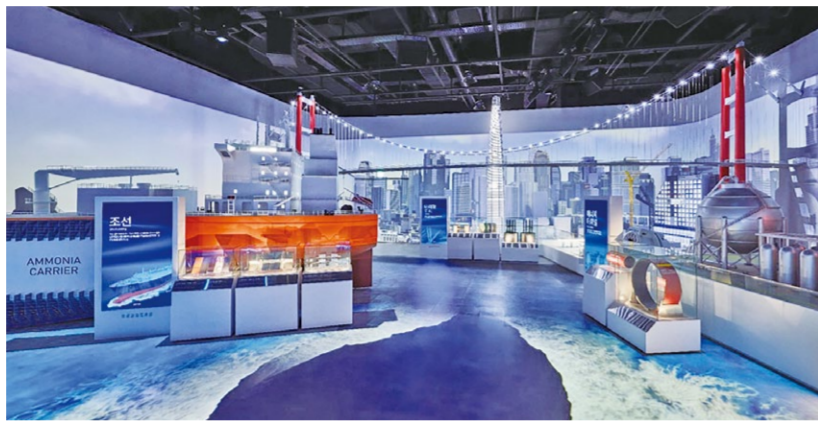
Park1538 광양 포스코 홍보관 내부

첫 코스로 방문하는 서울대학교 남부연습관 관사는 일제강점기 경성제국대학 남부연습관 내에 지어진 직원 숙소다. 관사는 복도를 중심으로 양쪽에 방이 배치된 중북도 구조. 문지방 위에 설치된 환기창 등 전형적인 일본 주택의 구성 형식을 보여준다. 서울대학교