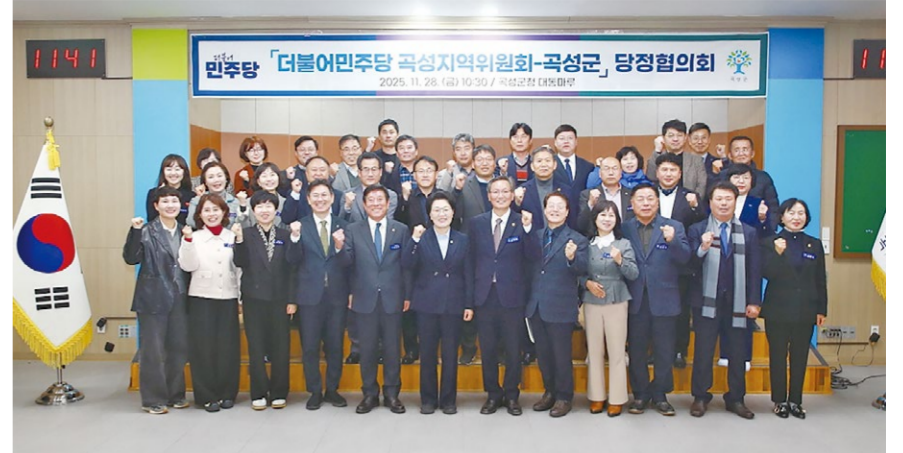
더불어민주당 곡성지역위원회가 지난달 28일 곡성군과 당정협의회를 가졌다.

광전매일신문 TEL. (062) 525-9775 FAX. (062) 528-4566