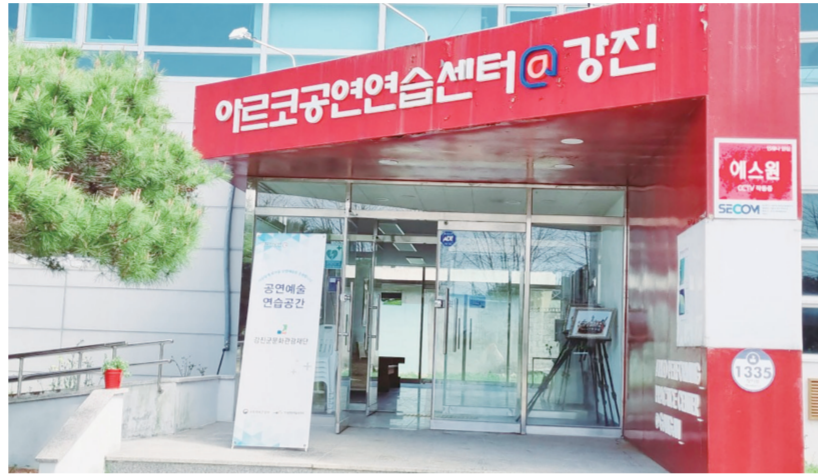
높아 주변에도 사용을 권하고 있다"고 말했다.

임 단장은 "특히, 필요한 시설들이 한 공간에 갖춰져 있어 동선을 최소화할 수 있는 부분이 단원들의 만족도가