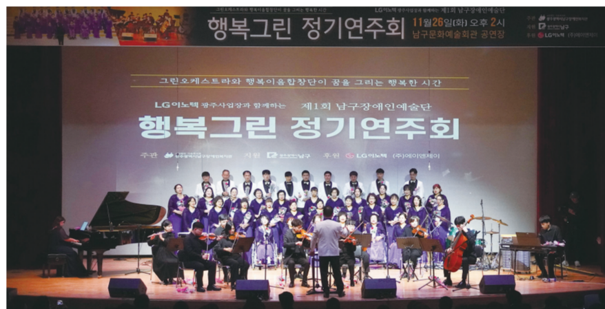
소리별 앙상블과 협연해 헨델의 모음곡인 '알라 혼파이프'와 프랑스 프로방스 지방의 8분의 6박자 춤곡인 '파랑달' 등을 연주하며 관객들에게 따뜻한 울림을 전한다.

장애인 예술단 운영을 맡고 있는 남구 장애인복지관 관계자는 "정기 연주회는 우리 단원들에게 또 한번의 도전 무대이자 기회의 장이다. 또 관객분들에게는 예술로 하나되는 남구의 감동적인 모습을