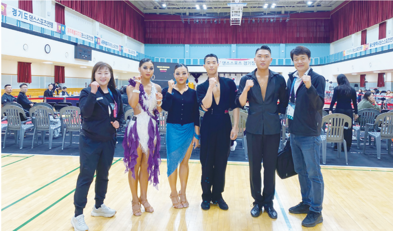
제106회 전국체육대회 댄스스포츠 종목에서 금3, 은2개를 획득한 댄스스포츠 선수들이 단체사진을 촬영하고 있다.