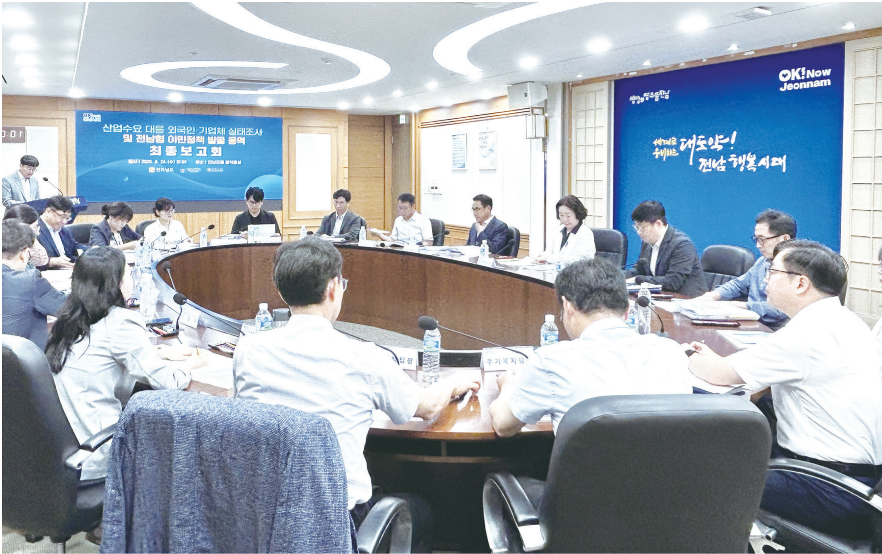
전남도, 외국인 주민 기업체 실태조사 및 전남형 이민정책 모델 발굴 용역 최종보고회.