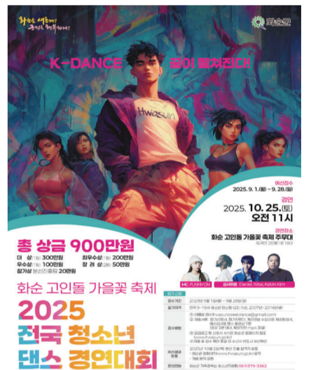
게 된다. 시상 규모는 총 900만 원으로 대상(1명) 300만 원, 최우수상(1명) 200만 원, 우수상(1명) 100만 원, 장려상(2팀) 50만 원, 참가상(10팀) 20만 원의 상금이 수여된다. 본선 당일에는 특별 축하공연 무대도 펼쳐질 예정이다.

예선은 접수된 팀을 대상으로 동영상 심사를 통해 15개 팀을 선발하며, 본선에 진출한 참가자들은 10월 25일 화순 고인들 가을꽃 축제 주무대에서 경연을 펼치