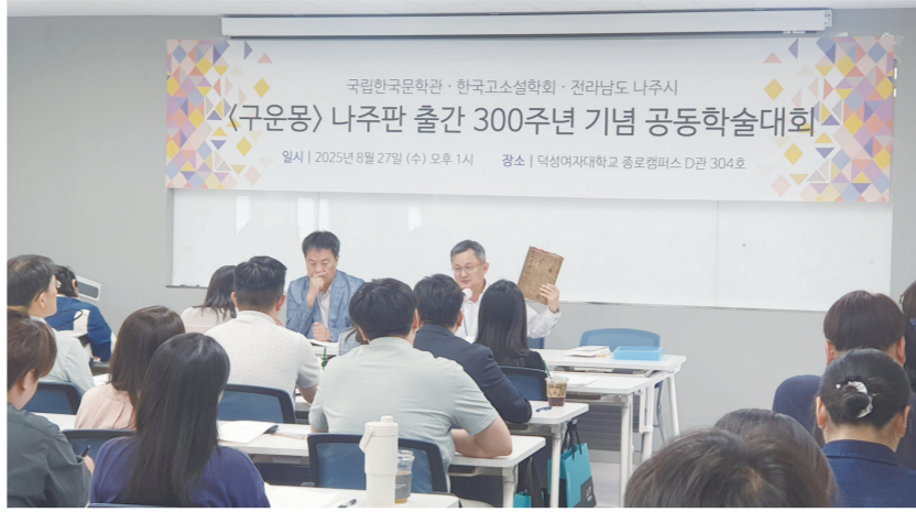
지난 27일 덕성여대에서 '구운몽' 나주판 출간 300주년 기념 공동학술대회가 열렸다.