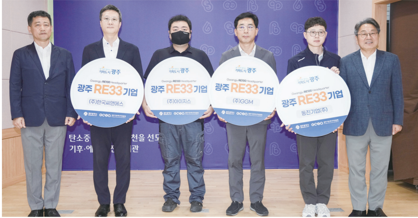
'RE100 예비기업 선언식'도 개최했다.

시·기후에너지진흥원·도시공사 등 참여... 에너지정책 컨트롤타워 지역기업 10곳 'RE100 전환' 선언... 민관 에너지 거버넌스 강화