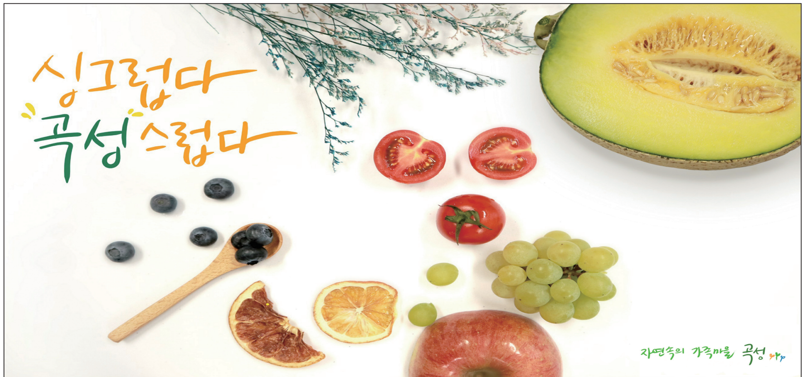
자연속의 가족매일 곡성

자세한 모집 공고는 박람회 공식 누리집의 '고시/공고' 게시판에서 확인할 수 있다. 신청에 필요한 양식과 유의 사항은 해당 게시판에서 볼 수 있으며, 최종 합격자는 9월 1일 누리집과 개별 통보를 통해 발표될 예정이다. /유인 기자